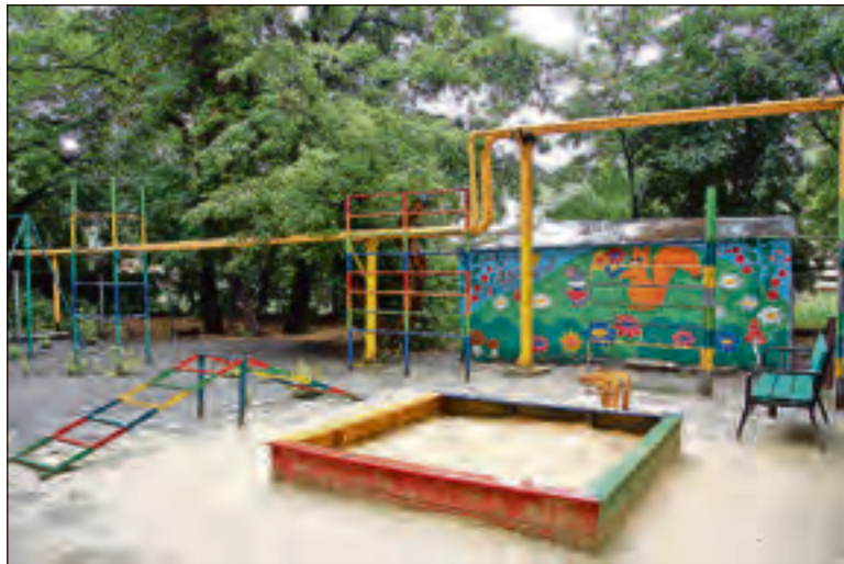
Видимо, так выглядит идеальное мироустройство childfree — свободное от детей

«Не знаю, кому эти детки доставляют радость, но меня они изрядно достали! Пока училась в школе, соседка за стеной родила, и это