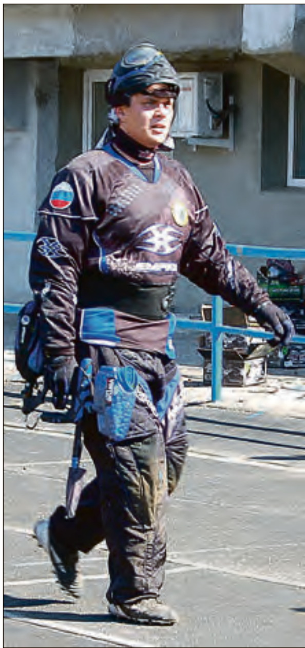
Выходя из дому, будьте во всеоружии...

Каждый из нас — маленький человек в большом городе. И даже те, кто большую часть времени проводит прячась от реальной жизни за деньгами и должностями, тоже не застрахованы от того, чтобы завтра стать маленькими людьми. Маленькие люди встречаются каждый день с хамством, невежеством, непрофессионализмом, небрежным отношением. И у них есть на выбор два варианта — понурить плечи и отойти в сторону или попытаться хотя бы заявить о своём праве на уважение. Нет институтов, способных помочь человеку. Усилить его юридически, дать веру в правоту и свои силы. Беда практически каждого населённого пункта в России сегодняшнего дня в том, что маленький человек встречается с неуважением без защиты. Практически в одиночку противостоит хорошо отлаженному механизму безответственности. Саратов на карте больших городов страны никакого не исключение.