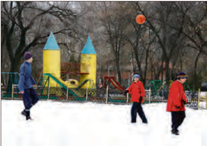
Эти ракеты в Детском парке не подвергаются «реконструкции» уже четвёртое десятилетие

Второй этап — восстановление освещения на территории парка — подразумевает установку светильников торшерного типа на 53 новых опоры и установку 12 светильников на опорах, сохранившихся с прежних времён. Причём, как отметил докладчик, работы второго этапа вынужденно прервет работы первого, озеленительного, так как придётся прокладывать подземные кабели и перекапывать газоны. Но после прокладки кабеля работа с зелёными насаждениями продолжится, заверил Да-