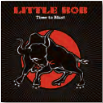
Little Bob Time To Blast, 2009

Продолжаем раскопки в завалах конца прошлого года. Не будем утверждать, что жемчужины попадаются часто. Всё больше обычный материал, так сказать, порода.