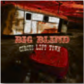
Big Blind Circus Left Town, 2009

Что-то в музыкальном отношении 10-й год никак не начнётся в нашем городе. По этой причине продолжаем обзирать последние пластинки 2009-го.