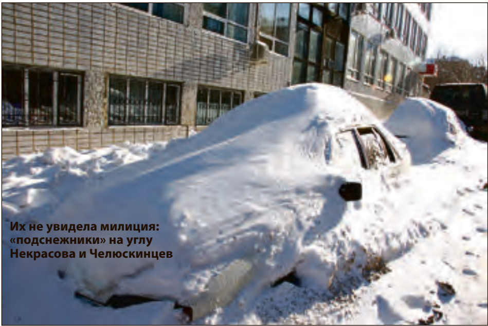
Их не увидела милиция: «подснежники» на углу Некрасова и Челюскинцев

Хозяева называли разные причины: одним авто не нужно, другим некуда ставить, третьи не смогли выколотить колёса из льда да так и бросили. В результате за оставление машины в неположенном месте милиционеры оштрафовали 100