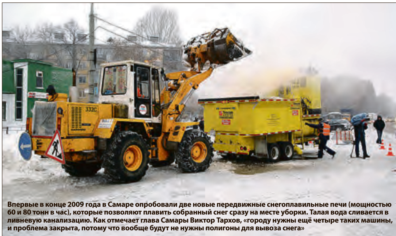
Впервые в конце 2009 года в Самаре опробовали две новые передвижные снегоплавильные печи (мощностью 60 и 80 тонн в час), которые позволяют плавить собранный снег сразу на месте уборки. Талая вода сливается в ливневую канализацию. Как отмечает глава Самары Виктор Тархов, «городу нужны ещё четыре таких машины, и проблема закрыта, потому что вообще будут не нужны полигоны для вывоза снега»

Мы поинтересовались этим в администрациях соседних Волгограда, Воронежа, Пензы, Тамбова, Самары и Ульяновска.