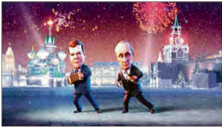
Появление в программе Первого канала «МультЛичности» персонажей с лицами Медведева и Путина вызвало живое обсуждение в отвыкшей от таких вольностей прессе

Брежнев, сам того не желая, подарил соотечественникам не-