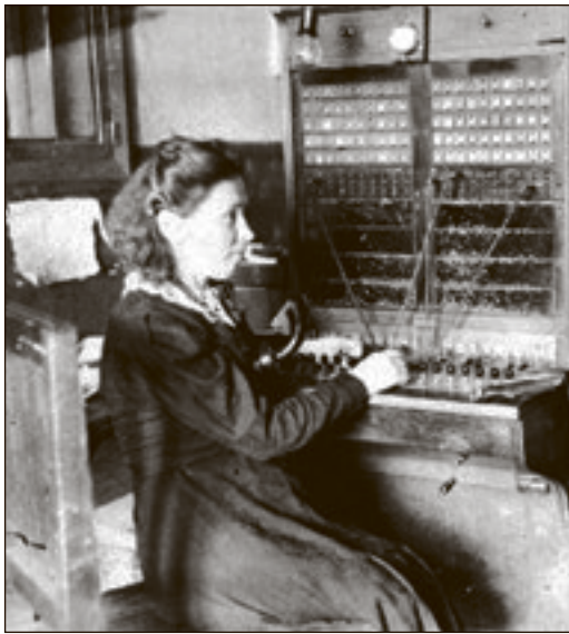
Барышня у коммутатора...

«Девушка, здравствуйте! Как вас звать? Тома. Семьдесят вторая! Жду, дыханье затаю!