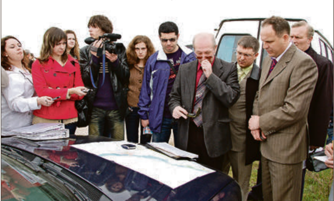
Год 2008-й: экспертная комиссия определила место строительства аэропорта — поле под селом Сабуровка

«Саратовский аэропорт не совсем вычеркнули из плана федерального финансирования, а отбросили на три года, — объяснил депутат. — Однако изначально было решено, что регион может рассчитывать на помощь центра только после того, как сам сделает определённые шаги к реализации проекта развития аэропорта. Прежде чем говорить о новом строительстве, нужно подготовить проектно-сметную документацию. И эта обязанность возложена как раз на регион. Те 60 миллионов рублей, что были заложены в бюджет 2010 года, будут направлены именно на эти цели. К тому же есть надежда, что текущий год будет лучше предыдущего, а значит, и в 2011-м ситуация может измениться в лучшую сторону. Всё не так страшно. Работа над проектом аэропорта в регионе будет продолжаться. Ведь ни у кого не вызывает сомнения, что региону нужен новый аэропорт, новая взлётная полоса и возможность для граждан летать в разные точки страны и мира. То, чем мы располагаем сейчас, конечно, тоже хорошо, но самолёты у нас летают далеко не везде, да и устарело уже многое».