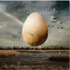
Wolfmother Cosmic Egg

Лидер австралийской группы Wolfmother Эндрю Стокдейл уверен, что великие группы шестидесятых-семидесятых не доиграли своё. «Сколько лет, например, выступали Deep Purple в своём лучшем составе?» — спрашивает Эндрю сам себя. И отвечает: «Четыре года. Зато какой след великие группы оставили в мировой музыке! Все знают, что первый диск Beatles начинается с I Saw Her Standing There, a Led Zeppelin — с Good Times Bad Times». Попутно Стокдейл обидел поп-рокеров из Oasis. «Ну, кто помнит, как называется первая песня с их первого альбома?»