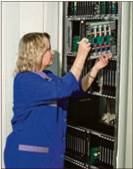
...и на цифровой АТС