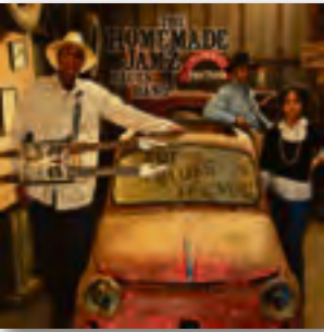
The Homemade Jamz Blues Band I Got Blues For You, 2009