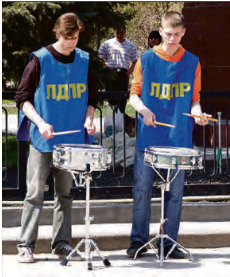
В этой партии любят барабанить, да чтобы погромче...

Сине-жёлтые выступили за продление срока полномочий президента и депутатов Госдумы до пяти лет и предложили совместить выборы. Жириновский высказался за ликвидацию Совета Федерации и за сокращение числа депутатов Госдумы до 300 человек.