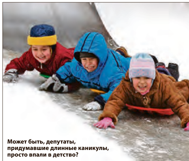
Может быть, депутаты, придумавшие длинные каникулы, просто впали в детство?

Из европейских экскурсионных туров самой дешёвой оказывается поездка в Прагу: 67 тысяч рублей на двоих с завтраками в оте-