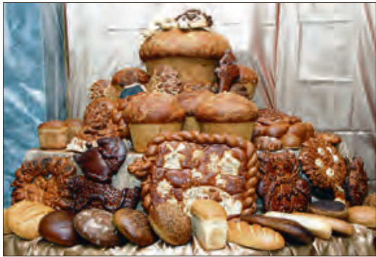
На праздничных выставках сельскохозяйственная продукция представлена в наилучшем виде

Для сравнения: в США и Франции уровень обеспеченности продовольствием собственного производства составляет более 100 %. Германия обеспечивает себя продуктами питания на 93 %, а Италия — на 78 %.