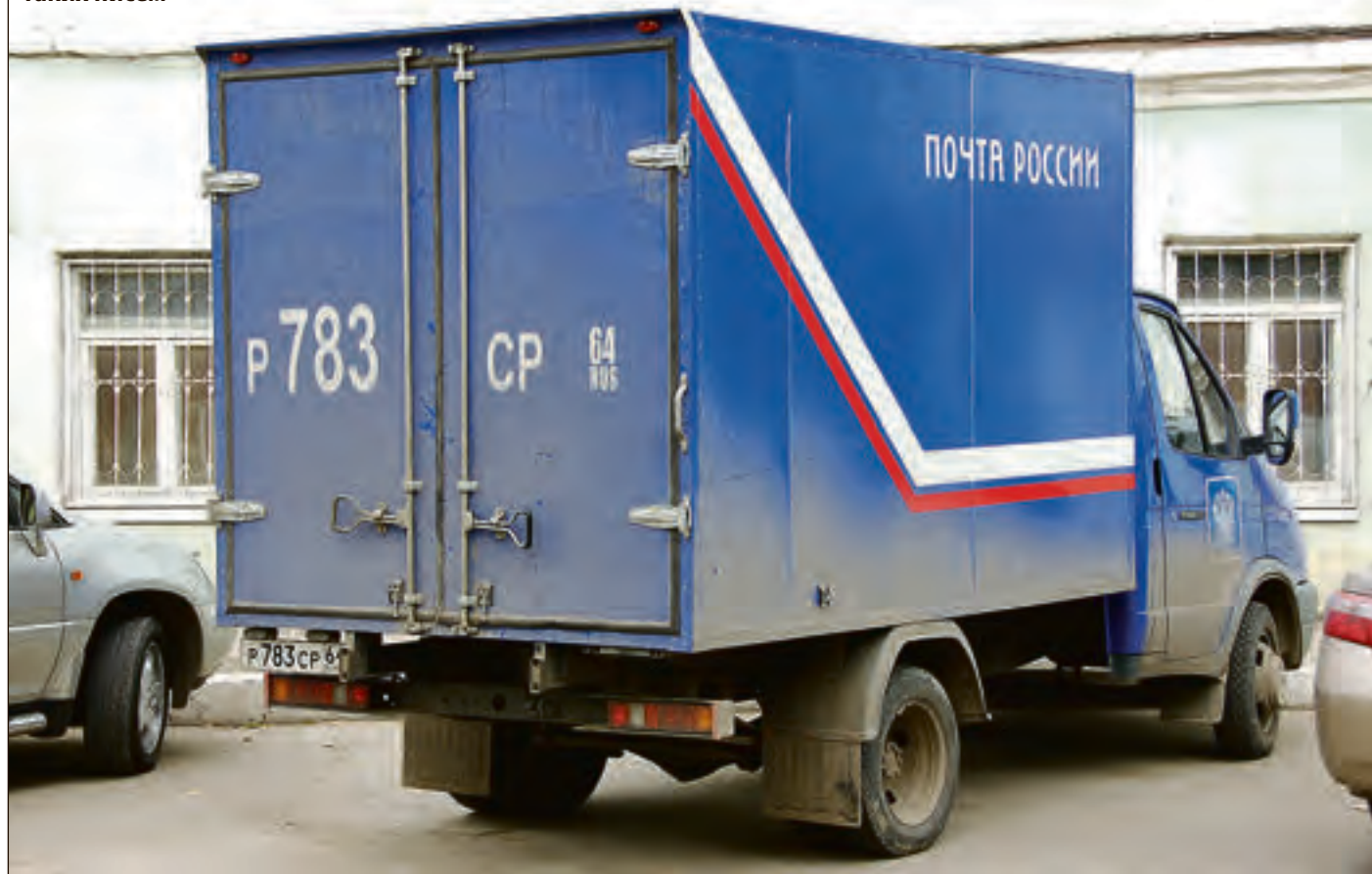
Желаем себе и коллегам полных фургонов таких писем

Вместе с уполномоченным по правам человека редакция с интересом ждёт ответа от прокуратуры.