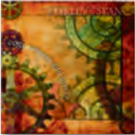
Steeleye Span Gods, Wheels And Lovers, 2009