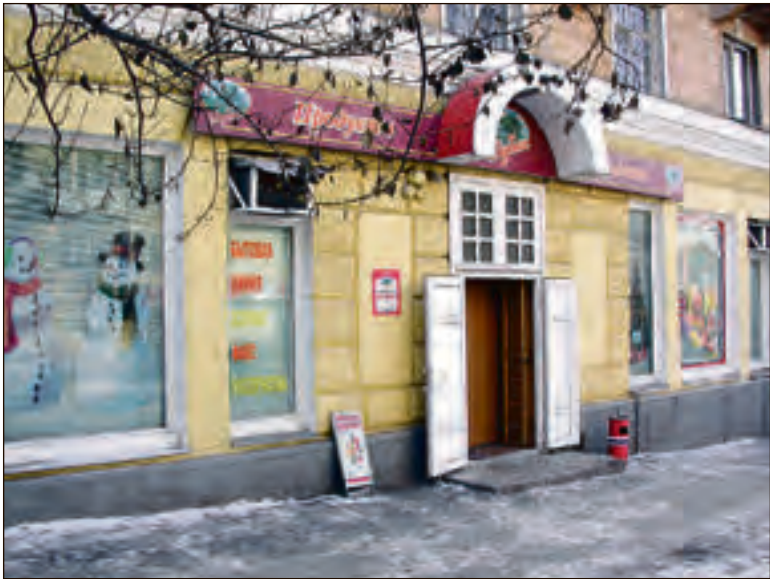
А в «Подписных» на Вольской и Бахметьевской магазин «Продукты» фирмы «Дубки». Здесь же — закусочная, можно пропустить кружку пива или чего покрепче

нее, он вывешивался в магазине и становился на несколько месяцев предметом бурных обсуждений и затаённых мечтаний. Но дату подписки на каждое из изданий объявляли за несколько дней. Моментально возникала очередь: одни и те же активисты, постоянно крутившиеся в магазине и именовавшиеся Советом содействия, начинали запись. Начи-нали, естественно, с себя.