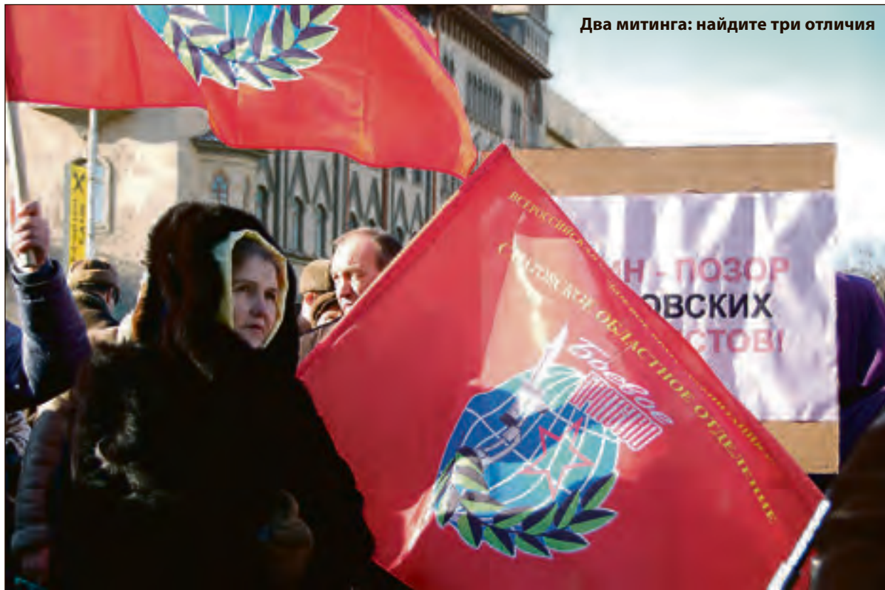
Два митинга: найдите три отличия