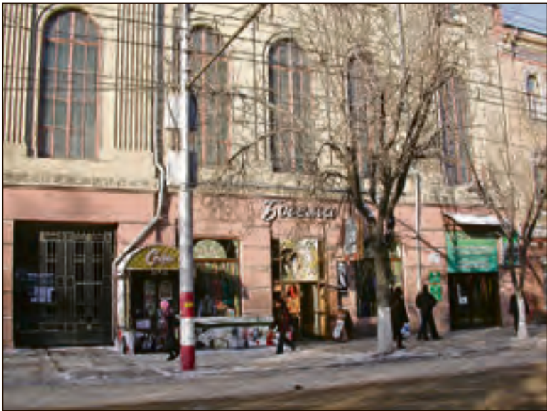
«Подписные» на Горького давно забыли о своём книжном прошлом

План подписки на год, то есть перечень изданий, был известен зара-