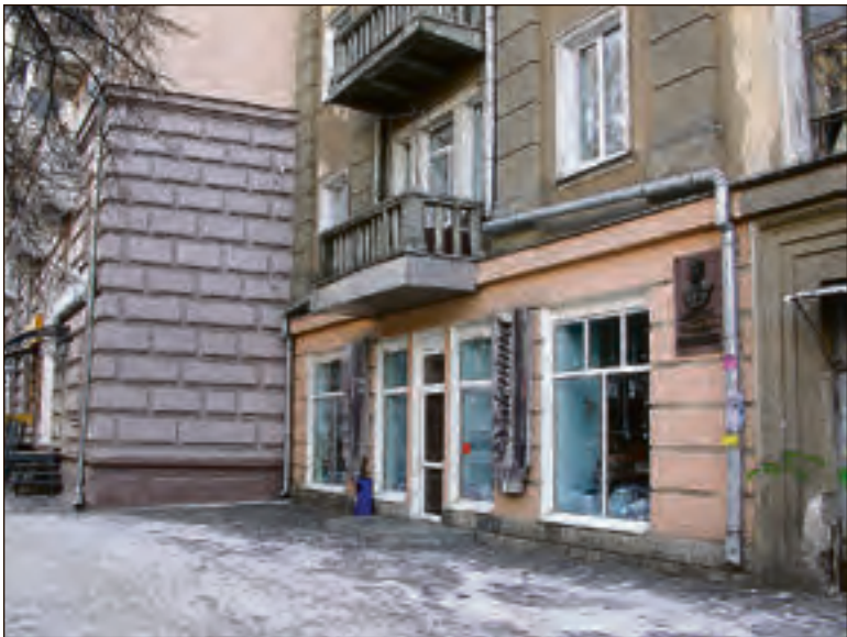
В «Подписных» на Советской до недавнего времени торговали унитазами, теперь там, как и повсюду, обувной магазин