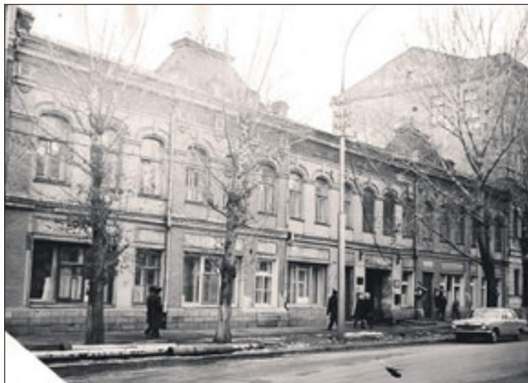
В этом здании на площади Революции школа проработала четверть века