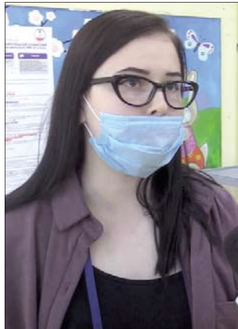
В день выборов сотрудники УИК не пускали наблюдателей в туалет

Все началось с того, что член комиссии с правом совещательного голоса