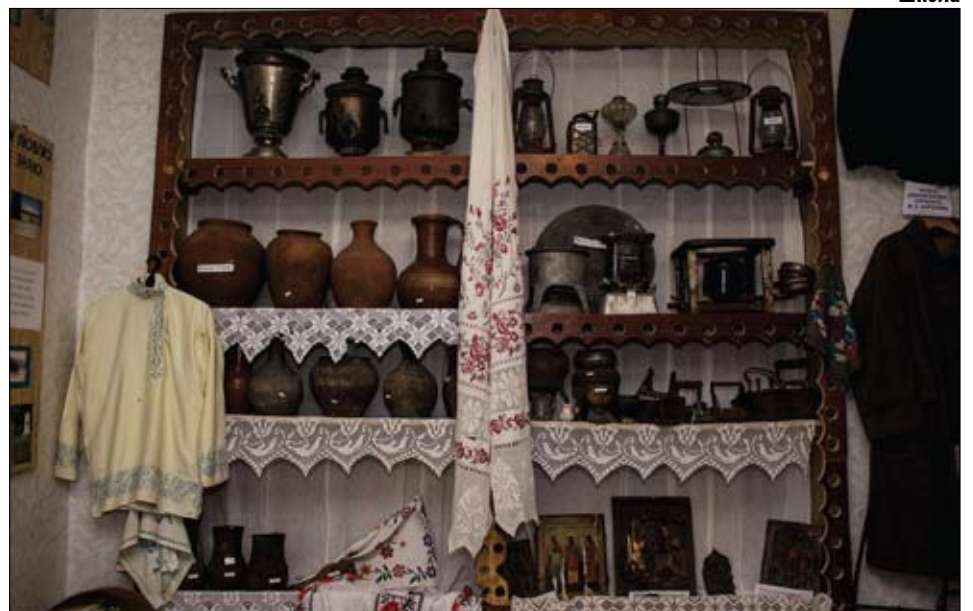
Экспонаты школьного музея