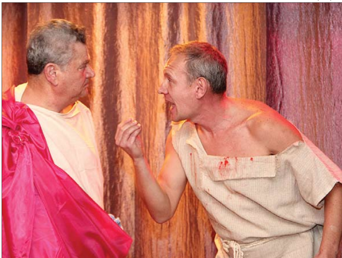
Репетиция пьесы «Забить Герострата»

Одну из главных ролей – ростовщика Крисиппа, придумав-