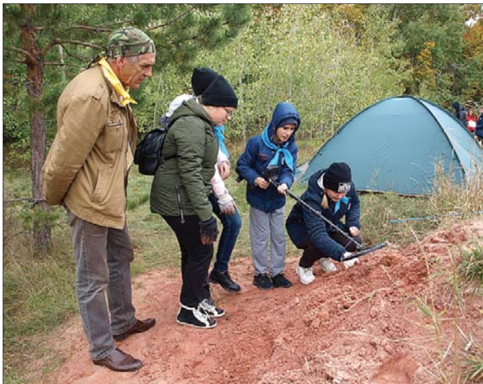
Поиск спрятанных артефактов

Деревянный двухэтажный домик, на участке – беседка под столовую, умы-