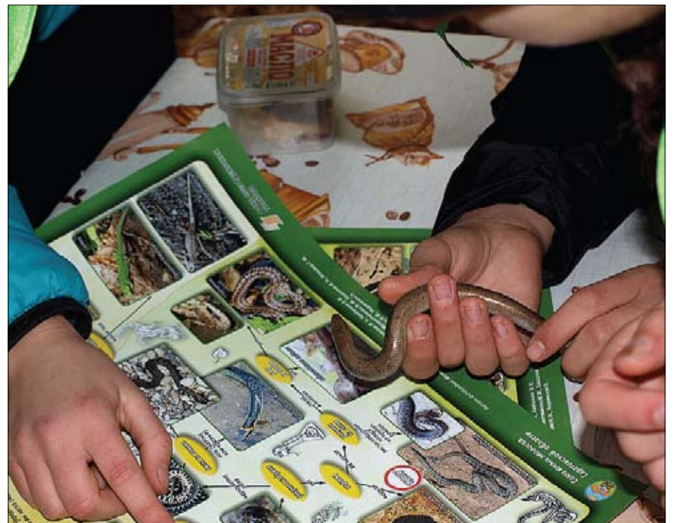
Веретенница – безногая ящерица