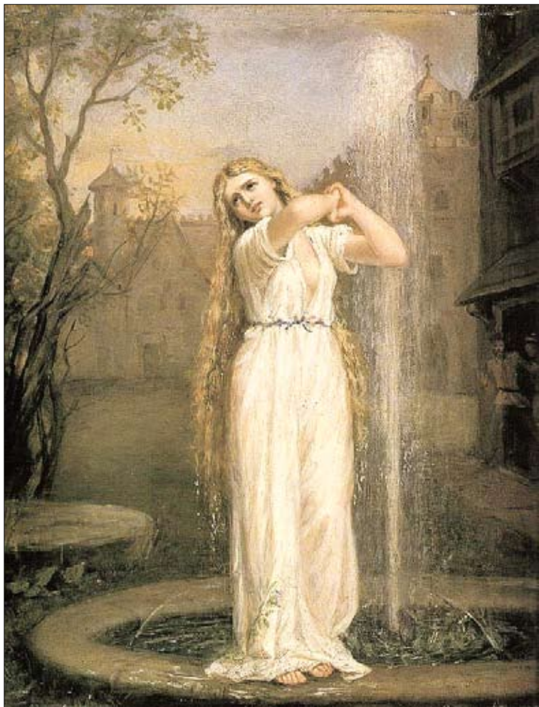
Ундина Джона Уильяма Уотерхауса