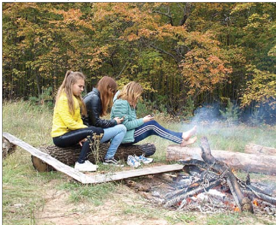
Костровая поляна. Обогрев