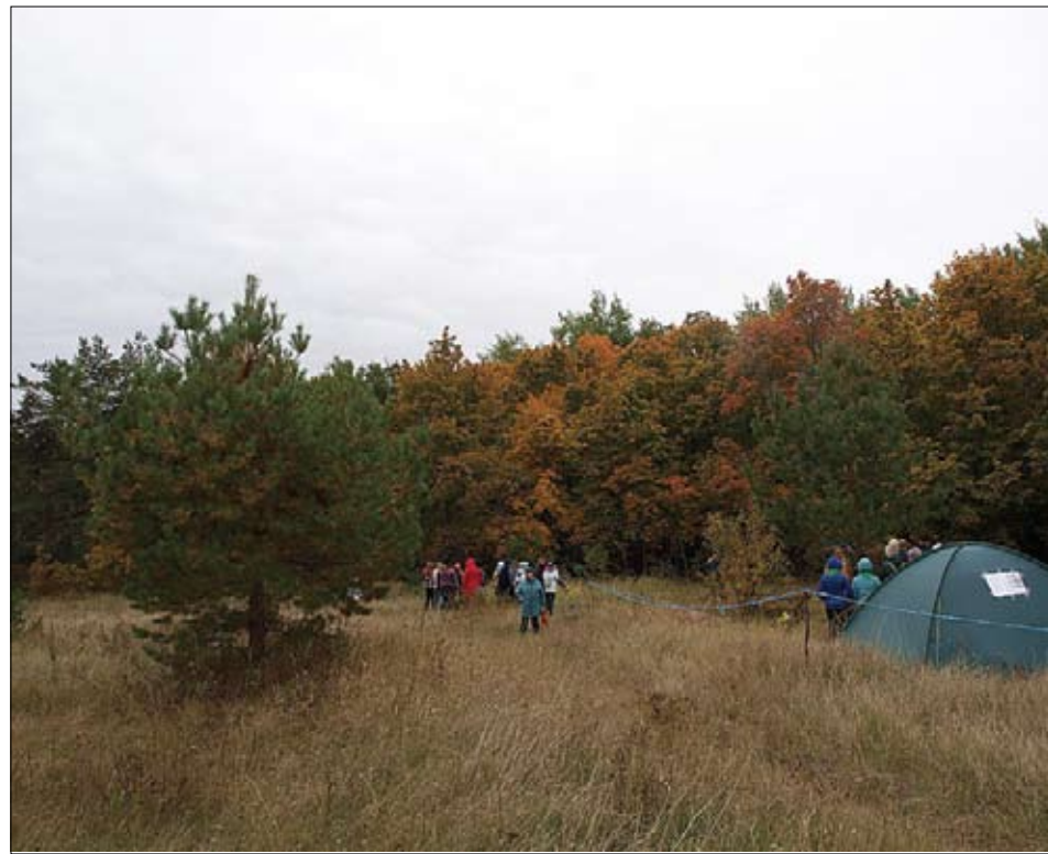
Участники первого регионального слета юных краеведов

жить в полевых условиях, изучают природу, проводят исследования и лесные мини-конференции, а по вечерам поют песни у костра.