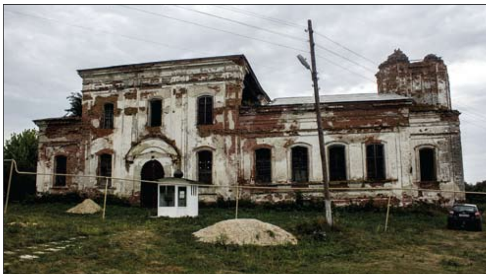
Храм Архангела Михаила