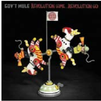
Gov't Mule Revolution Come, Revolution Go 2017

По-разному можно оценивать приход к власти Дональда Трампа, но, не поверите, есть и положительные моменты. Как известно, большинство музыкантов и вообще людей искусства придерживаются левых, а то и откровенно левацких взглядов. Богема, понимаете ли. И в победе Трампа на выборах они увидели признаки приближающегося апокалипсиса. И решили в меру своих сил противостоять надвигающемуся злу. Чем может ответить музыкант? Ясное дело – новыми песнями. В прошлом номере мы писали о новом альбоме Роджера Уотерса, обратив больше внимания на музыку. Но ведь альбом политизирован до крайности и не зря называется Is This The Life We Really Want? – «Такую ли жизнь мы реально ждали?»