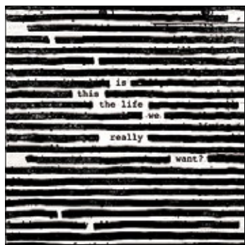
Roger Waters Is This The Life We Really Want? 2017

Никто не может сказать точно, когда началось соперничество двух лидеров Pink Floyd – Роджера Уотерса и Дэвида Гилмора. Есть подозрение, что с того самого момента, когда уличный музыкант Дэвид Гилмор сменил в составе группы погружавшегося в пучину наркотического безумия Сида Баррета, музыканта, которого называли Crazy Diamond – сумасшедший бриллиант.