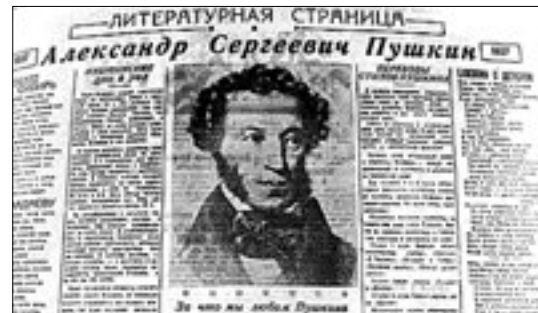
Литературная страница Александр Сергеевич Пушкин

В Пугачеве совхозно-колхозный театр отметил печальную дату постановкой пьесы «Борис Годунов». В селах районов провели собрания колхозников, посвященные всенародно любимому поэту.