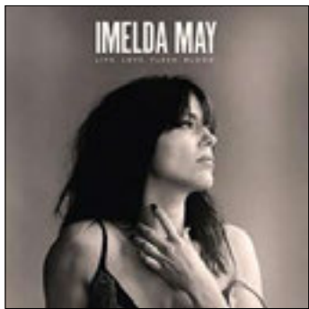
Imelda May Life. Love. Flesh. Blood 2017

Итак, вопрос: в чьих руках теперь знамя ирландского блюза? То самое знамя, которое поднимали над миром такие гениальные музыканты, как Рори Галлахер и Гэрри Мур, пока ирландские привычки не свели их в могилу в расцвете лет. На самом деле никого и близко нет,