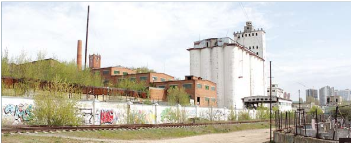
Так выглядит Мельница Шмидта сейчас