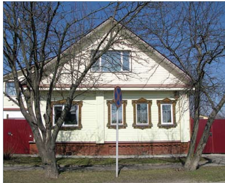
Суздаль. Современный домик «в стиле»