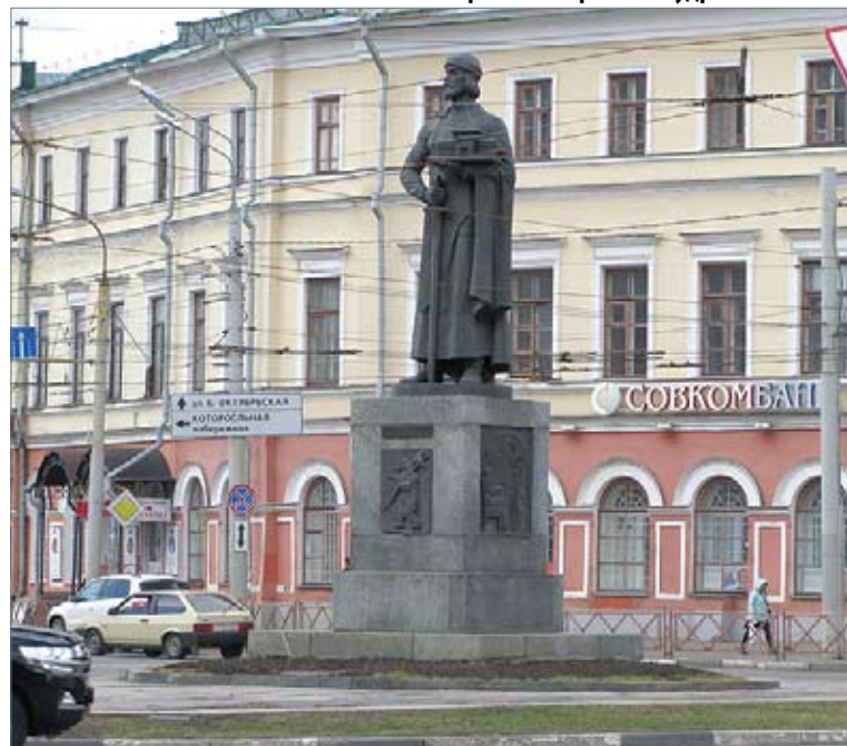
Ярославль. Ярослав Мудрый с банком

А что отвечают на подобный вопрос на Соколовой горе саратовские экскурсоводы? Зловонные кабинки, гордо именуемые биотуалетами, частенько бывают закрыты, да их еще и найти нужно. Вариантов ответа два: «для вас – везде» либо «оставьте след на саратовской земле» (в смысле обогатиться в кустах). Такой вот у нас центр туризма.