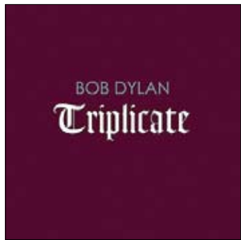
Bob Dylan Triplicate 2017

Нобелевский лауреат Боб Дилан выпустил новый, на этот раз тройной альбом. В него, соответственно, вошли три диска – Til The Sun Goes Down, Devil Dolls и Comin' Home Late. У нас отчего-то выпущен двойной альбом, но песни все на месте. К разочарованию российской публики Triplicate, как и два предыдущих – Shadows In The Night и Fallen Angels, посвящен американской эстрадной песне. Тройник состоит из тридцати стандартов сороковых и пятидесятых годов прошлого века. Если это что-то кому-то скажет, можно добавить, что все эти песни исполнял кумир американской публики Фрэнк Синатра.