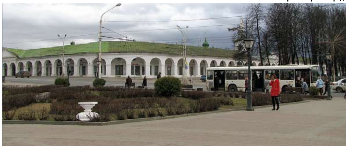
Кострома. Торговые ряды

В Суздале была первая ночевка. Нам повезло – заселились в отель «Сокол», расположенный в самом центре Суздаля. Старинное здание, отреставрированное снаружи и с шикарным ремонтом в номерах. Но главное – рядом местный кремль, торговые ряды с открытыми галереями вдоль бывших купеческих лавок. Такие конструкции торговых цен-