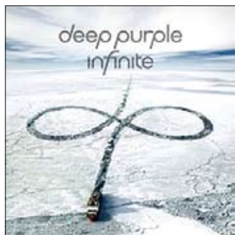
Deep Purple Infinite 2017

Великая группа Deep Purple, одна из основоположников жанра тяжелый рок, выпустила новый альбом. Некоторые источники сообщают, что последний. Мы же предпочтем не верить этому хотя бы по той причине, что Infinite продемонстрировал – творческий потенциал квинтета далеко не исчерпан.