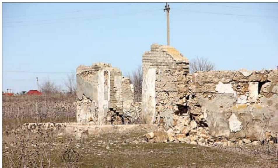
Руины разрушенного колхоза

Всего в Перекопновском муниципальном образовании, по официальным данным, насчитывается 2136 жителей, в том числе 1029 в селе Перекопном. Более тысячи жителей МО – трудоспособные граждане старше 18 лет, треть из них фактически не работает. В муниципальном образовании проживает 642 пенсионера и 380 детей. В школе села Перекопного, рассчитанной на 450 мест, учатся 144 ребенка, в детском саду вместимостью 90 мест – 41 воспитанник. Как отмечено на муниципальном сайте, «предприятием крупного сектора экономики на территории Перекопновского муниципального образования не имеется». По землям МО пролегают 41,9 километра дорог, из них только 12 процентов асфальтированы. Средняя