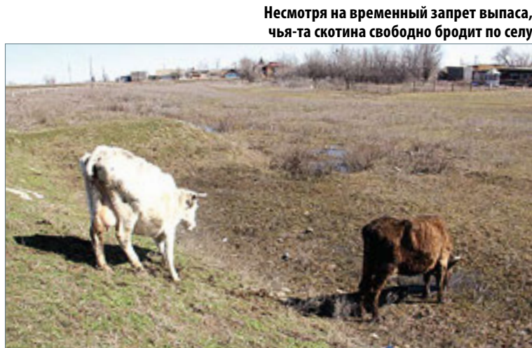
Несмотря на временный запрет выпаса, чья-то скотина свободно бродит по селу