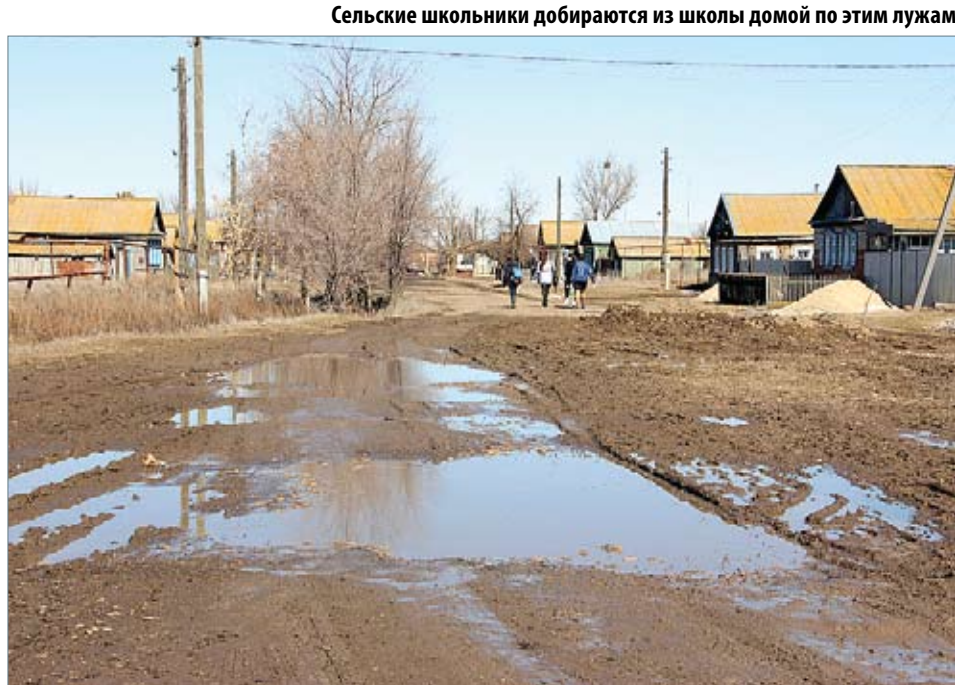
Сельские школьники добираются из школы домой по этим лужам

По подсчетам администрации поселения, за год поголовье скота в личных подворьях увеличилось на 9–11 процентов. Возмож-