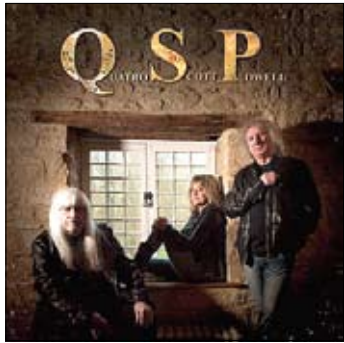
Quatro Scott Powell Quatro Scott Powell 2017

Первая супергруппа этого года. Для справки: супергруппа – союз музыкантов, получивших известность в составе других коллективов. Представляем наших участников: Дон Пауэлл – барабанщик Slade. В свое время музыкальные критики пытались протащить Slade по разряду глэм-рока, но время доказало: это великая группа вне всяких рамок и разрядов. Энди Скотт – гитарист Sweet. Здесь спорить не будем: сказано глэм – значит глэм. У нас вообще считается, что глэм значит гламурный, а гламур в среде нормальных людей принято презирать. На самом деле этот жанр подразумевает «театральную эффектность костюмов, макияж» и так далее. Скажем, упомянутые уже Slade носили бакенбарды, как у кэбменов XIX века, а их вокалист Нодди Холдер пел в цилиндре. Это скорее определение манеры исполнения, но не самой музыки.