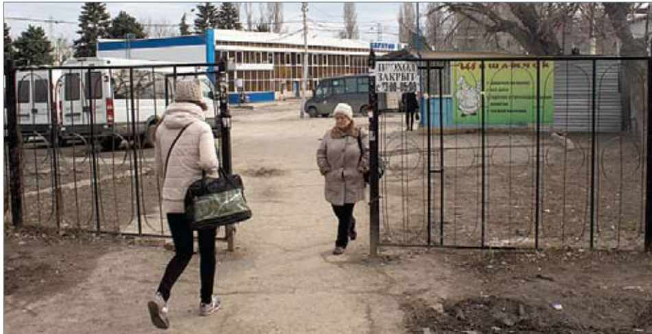
Через эту калитку сейчас ходят люди