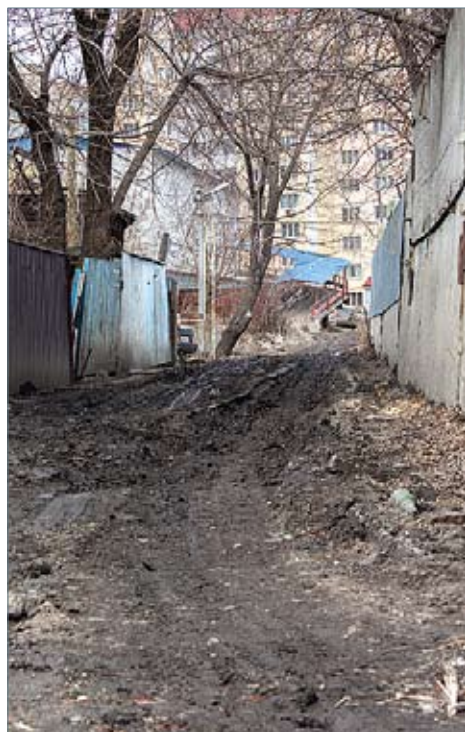
По этой дороге им придется идти в обход

– Допустить свободный доступ на территорию автовокзала я не уполномочен. И не знаю, кто на себя возьмет такую ответственность. Мы согласны пойти на любые просьбы, требования, которые будут направлены на снижение социальной активности и напряженности граждан, но для этого мы должны заручиться гарантиями или разрешением федеральной службы безопасности, которое официально позволит нам отойти от буквы закона по требованиям безопасности и внести изменения в план транспортной безопасности саратовского автовокзала.