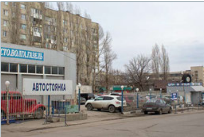
Если депутаты озаботились транспортной безопасностью, но жалеют людей, то они пробьют один проход через эту автостоянку...