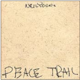
Neil Young Peace Trail 2017

У Данте было девять кругов ада. Мир с тех пор очень изменился, и если бы сейчас возникла необходимость создать ад по дантовским принципам, то в этом аду должно быть не меньше ста девяти кругов. Судите сами – ведущие ток-шоу, российские политологи, российские же звезды поп-музыки, да много кого еще нужно туда поместить. Отдельный адский кружок надо организовать для дизайнеров альбомов современной музыки. Да, люди, которые пишут светло-серым по светло-зеленому, которые пользуются шрифтом размером меньше миллиметра, а также те, кто пишет названия песен готическим шрифтом или копирует почерк человека с болезнью Паркинсона, это когда руки трясутся, не заслуживают иной участи. Дизайнер последнего альбома Нила Янга как раз из этого числа – чтобы прочитать трек-лист, диск нужно поставить в компьютер, иначе не получится.