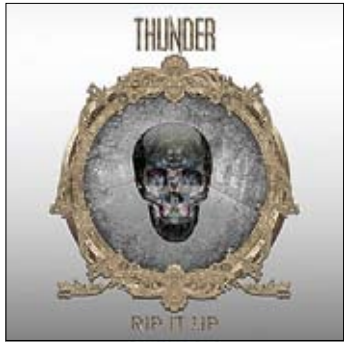
Thunder Rip It Up 2017