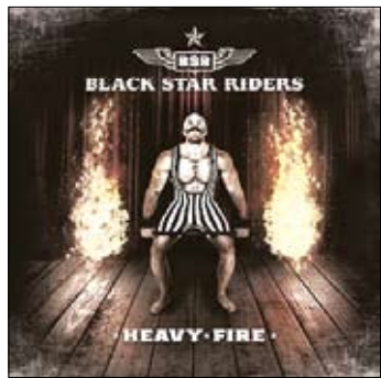
Black Star Riders Heavy Fire 2017

Перед нами тот случай, когда история группы интереснее их творчества, хотя, возможно, что у BSR есть свои фанаты. Но всё по порядку – была такая ирландская группа Thin Lizzy, славная как громкими хитами Whiskey In The Jar, Boys Are Back In Town, так и разудалым поведением практически всех своих участников.