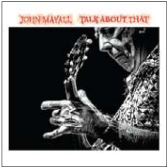
John Mayall Talk About That 2017