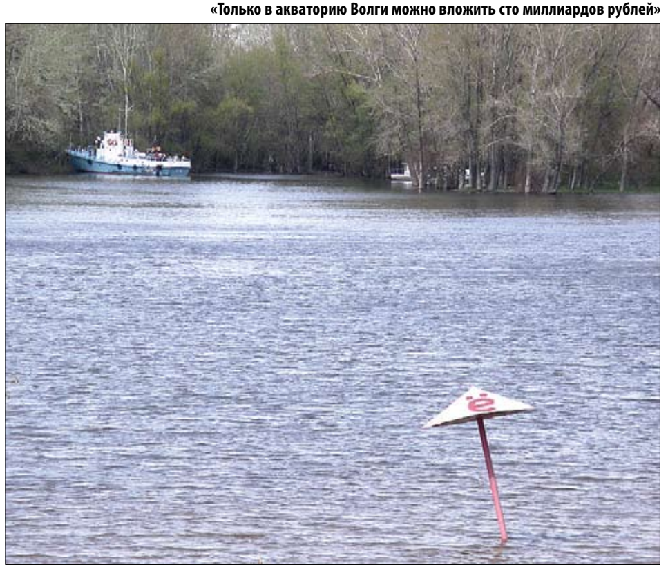
«Только в акваторию Волги можно вложить сто миллиардов рублей»

Пока пили чай, я всё время напряженно думал. Занятие непривычное, конечно, голова разболелась, но думать я не переставал. Каково же, интересно, при-