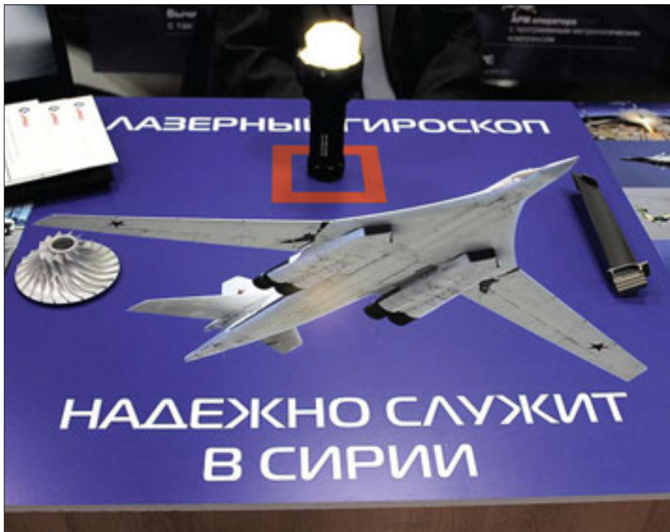
Лазерный гироскоп, надежно служащий в Сирии, – производство саратовского ООО «Лапик»

«Тем более, такие ситуации нельзя допустить в ОПК», – заявил губернатор Радаев, отметив при этом, что риски в оборонке, к сожалению, уже хорошо просматриваются.