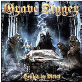
Grave Digger Healed By Metal 2017

Короткий рецепт, или, как сейчас говорят, лайфхак, как изготовить альбом в стиле хэви-метал. На обложке надобно изобразить пяток скелетов и одного покойника. Фоном – развалины, мрачное грозное небо, молнии. Название песен и группы в обязательном порядке пишется готическим шрифтом, и столь же обязательно – белым по темному фону. (В полиграфии этот прием называется выворотка.) Ах да, первое же дело – название группы. Что-то мрачное должно быть, inferнальное. Например «Могильщик» – Grave Digger. Названия песен должны соответствовать: «Глаз палача» – Hangman's Eye, «Ритуальное убийство» – Kill Ritual, «Смеемся вместе с дьяволом» – Laughing With The Devil. Глава преисподней – желанный гость в таких произведениях. Тексты – совпадают с названиями. Что-то вроде этого: «Небо в темных тучах/Люди плачут на улицах,/Спрятавшись в тени/. За-втрашнего дня не будет». Это из песни When Night Falls.