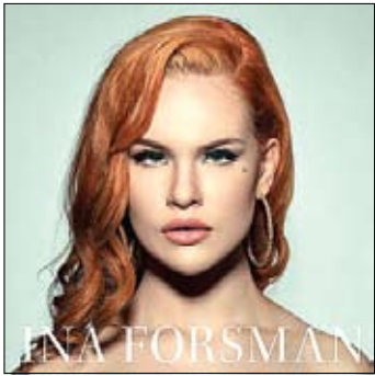
Ina Forsman Ina Forsman 2016

Приносим свои извинения читателям нашей рубрики: первые пластинки 2017 года задерживаются. Надеемся, что в следующий раз хоть что-то да будет.