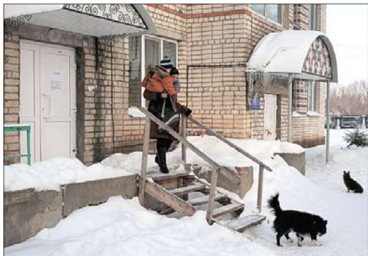
Корпус, в котором находится отделение лучевой диагностики

– На общем сходе, – рассказывает Ирина, когда мы спускаемся к машине, – отец одного из этих детей говорил, что ребенку его туберкулез лечили. И что он директора об этом предупреждал. Кто подтвердит может? Да на том сходе полсела было. Все слышали. Он громко говорил. (Забегая вперед, замечу, что эти слова никто из родителей, согласившихся с нами пообщаться, не подтвердил. Впрочем, и рассказывать о ситуации люди были не готовы: скажешь что-то против школы – и у ребенка тут же успеваемость падает, а лишние двойки и колы никому не нужны. – А.М.)