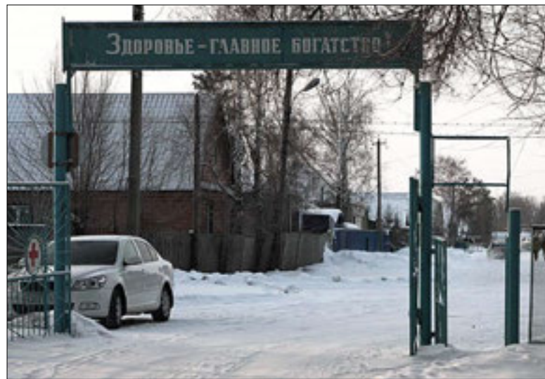
Выезд с территории Ивантеевской ЦРБ