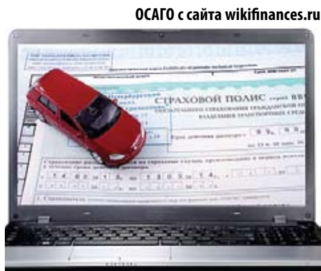
ОСАГО