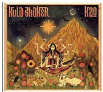
Kula Shaker K20 2016

Историю взаимных отношений рока и индийской музыкальной культуры принято писать, начиная с The Beatles. Дескать, именно музыканты великой четверки прониклись сначала индийской философией, съездили в Индию на встречу с Махариши Йога и так далее. На самом деле картина выглядит несколько иначе: сначала у Beatles появились индийские мелодии за авторством Джорджа Харрисона – например, Within You Without You (1967), потом была в 1968 году поездка в Тибет, а самого гуру язвительный Джон Леннон высмеял в песне Sexy Sadie. Но еще до этого Брайан Джонс – анфан террибль Rolling Stones – играл в нескольких композициях группы на ситаре. Конечно, нужно помнить и Kashmir – шедевр Led Zeppelin, преисполненный восточных мотивов.