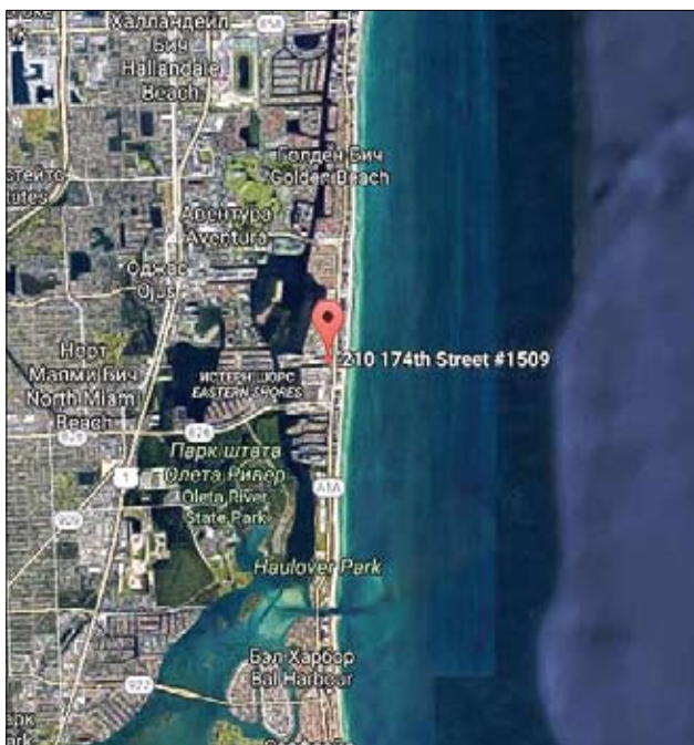
Американское место жительства (скриншот с Google Карты)