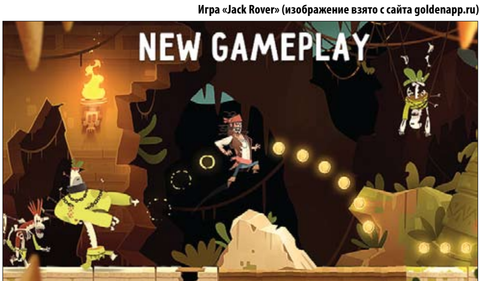
Игра «Jack Rover»