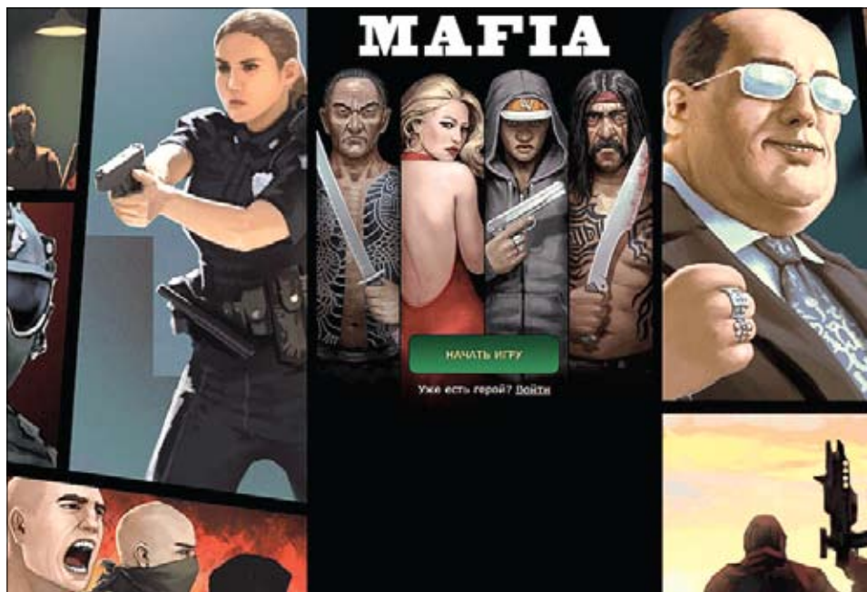
«Войны Кланов» (clans.mobi). Ещё одна браузерная игра, распространяемая саратовскими разработчиками

*Права на игру «Jack Rover» принадлежат компании «King Bird Studio».