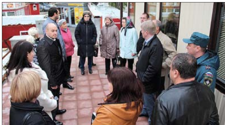
Вежливый визит общественников в ФОК «Южный». Бывает и по-другому