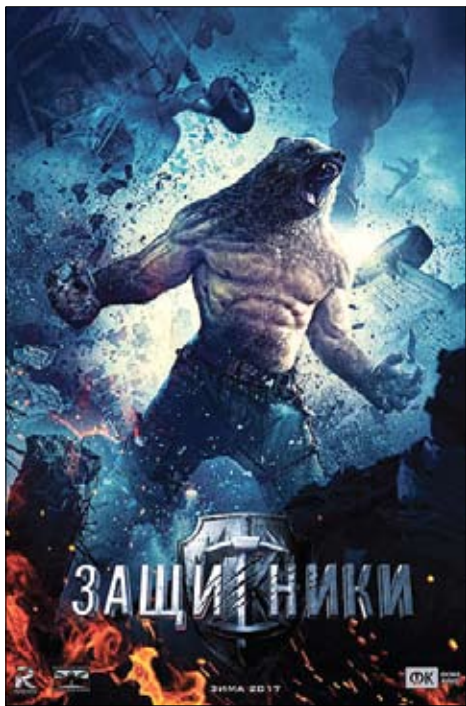
Постер к фильму «Защитники»