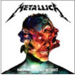
Metallica Hardwired...To Self-Destruct 2016

Вышел новый альбом Metallica с соответствующим имиджу группы названием, которое можно перевести примерно так – «Прошит (это компьютерный термин, в смысле – подготовлен) к самоуничтожению».