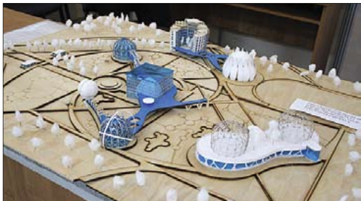
Участникам форума показывали проекты сказочного города Саратова: космический центр на месте приземления Гагарина... и продолжение городской набережной. Мечты и сны...

Обсуждение шло довольно бодро, но в рамках заданного государством вектора, на секциях с острыми темами участники мусолили замусоленное годами, не скатываясь в реальное обсуждение проблем. И только федеральный гость добавил немного драйва. В последний день форума член Общественной палаты России Игорь Шпектор «накрутил хвостов» всем саратовским на секции по проблемам ЖКХ, а на пленарном заседании искрометно, но зло шутил и даже поцеловал Александра Ландо.