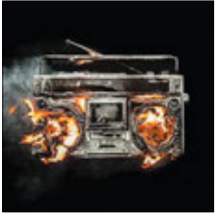
Green Day Revolution Radio

Пришла пора сказать несколько слов о музыкальных критиках. Понятно, что критиков никто не любит: ни сами музыканты, ни поклонники музыки. Никто не спорит, есть квалифицированные непредвзятые специалисты. Но большинство руководствуется иным принципом. Условно говоря, чем быть сотым человеком, написавшим, что Beatles великая группа, буду первым, кто скажет: они – полный отстой. Beatles от этого не убудет, а меня запомнят. Для того, чтобы раскритиковать того или иного музыканта, особых умений не требуется, зато есть пара приемчиков. Например, группа ищет что-то новое, выносим приговор – оторвались от корней. Если наоборот, то – музыканты застоялись, не ищут и не находят новых идей. Можно придрататься к текстам: поют о любви – значит, не видят всего, что происходит вокруг. Если же песни обо всей многогранности жизни – пожалуйста, и на это есть ответ: тематику черпают из новостных сайтов. Есть еще один любимый музыкальными критиками приговор, который обычно выносится удачной работе популярного коллектива. Звучит он так: пластинка N написана на потребу публике. Как будто музыканты должны писать для двух-трех сотен мужчин и женщин, окопавшихся в редакциях музыкальных изданий.