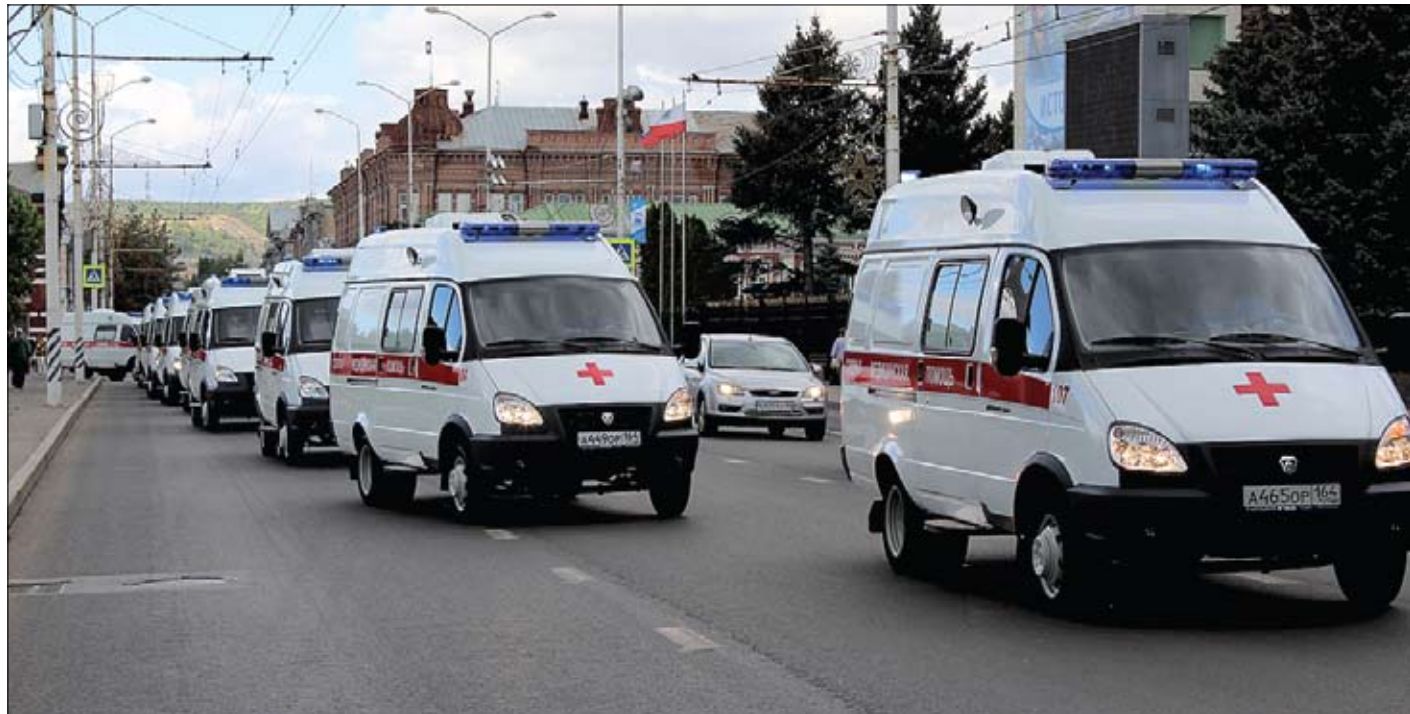
Московский подарок «с барского плеча»: подержанные автомобили скорой помощи идут торжественным маршем по Саратову. Что же, и на том спасибо!

Новости о сокращении расходов на медицину лились бурным потоком всю прошедшую неделю в федеральных СМИ.