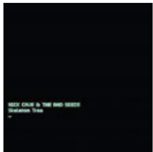
Nick Cave & The Bad Seeds Skeleton Tree 2016

Вполне возможно, что со временем эту пластинку Ника Кейва назовут «черным альбомом». Помните – у Metallica так было. И не только из-за цвета обложки, но и по причине мрачного до абсолюта настроения этой работы выдающего музыканта и поэта. Кейв никогда не был жизнерадостным творцом. Даже самый известный и самый доступный для слушателей его альбом, выпущенный в 1992 году, носил «веселое» название «Баллады убийц» – Murder Ballads. Из него суперпопулярный стал дуэт с Кайли Миноуг Where The Wild Roses Grow. Настолько популярным, что попал в ротацию наших FM-станций.