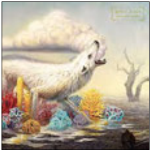
Rival Sons Hollow Bones 2016

Вот уже две трети 2016 года прошло, но чем этот год войдет в историю рок-музыки? С одной стороны, очередные альбомы выпустили Radiohead и The Kills. Великие старики – Элтон Джон, Боб Дилан, Эрик Клэптон, Пол Саймон – отметились альбомами, прямо скажем, разной степени ценности. Но крепнет ощущение, что этот год не станет вехой в истории. Нет, понятно, почему это происходит – пусть любителей рок-музыки становится все больше, но они разбрелись по своим «квартиркам», и то, что происходит у соседей, их не интересует. Поклонникам Metallica безразличны новые альбомы Джо Бонамасы, им лишь хочется, чтобы их любимцы не рвались из цеха, где куят металл. Хотя ясно, что Ларсу Ульриху давно тесно в этом жарком помещении. Но фанаты ждут нового Kill'Em All, а не экспериментов в со-пределных жанрах. Такая же история с еще одной выдающейся группой нашего времени – Green Day. Билли Армстронгу хочется играть разную музыку, а поклонники клянут его за отход от канонов панка.