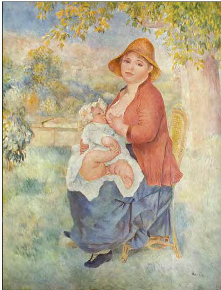
Пьер Огюст Ренуар - Дитя у груди (Материнство)