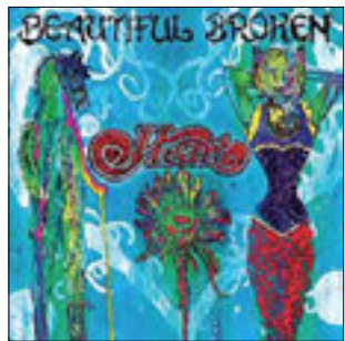
Heart Beautifully Broken 2016

Тоже история с именем. Имя, скажем так, скромное. Группа Heart – что это говорит обычному любителю музыки? Боюсь, немного. Да и фанатов группы трудно встретить, по крайней мере, в нашем городе. Однако у коллектива долгая и славная история. Heart был организован в 1974 году, в 1976-м была выпущена первая пластинка – Dreamboat Annie. Основу коллектива составили сестры Уилсон – Энн и Нэнси. Энн – вокал, Нэнси – гитара.