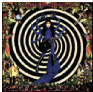
Purson Desire's Magic Theatre 2016

«Еще есть какая-то девчоночья группа – хочешь, возьми послушай», – сказал мне продавец маленького музыкального магазина и мой давний приятель.