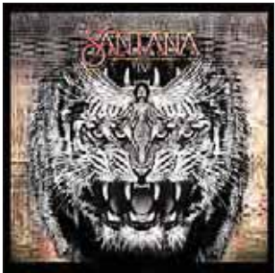
Santana Santana IV 2016

Этот альбом назван вызывающе скромно — «IV». Тот, кто не знаком или мало знаком с творчеством Карлоса Сантаны, не поймет. Тут разгадка в том, что еще на заре своей карьеры великий гитарист выпустил подряд три альбома без особых изысков в названиях — Santana I, II и III. Считается также, что музыканты, записывавшие этот альбом, и