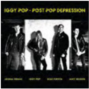
Iggy Pop Post Pop Depression

Итак, еще одна ветеранская работа, работа человека, которого не без оснований считают крестным отцом сразу двух направлений рок-музыки — панка и гранджа. Этого достаточно, чтобы любители музыки поняли, о ком идет речь. Конечно же, это Джеймс Ньюэл Остерберг-младший, всему миру известный как Игги Поп. Да этот тот самый человек, который