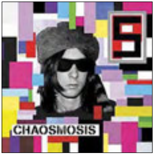
Primal Scream Chaosmosis, 2016

Прекрасно понимаем, что в наш адрес может быть высказано немало упреков в излишнем пиетете перед монстрами рока, перед его почтенными стариками. Отчасти упрек принимается. Вот вам представители среднего поколения — всего тридцать четыре года стажа, начиная с 1982-го. Всего-то 7 альбомов. Короче, встречайте: шотландцы из Primal Scream.