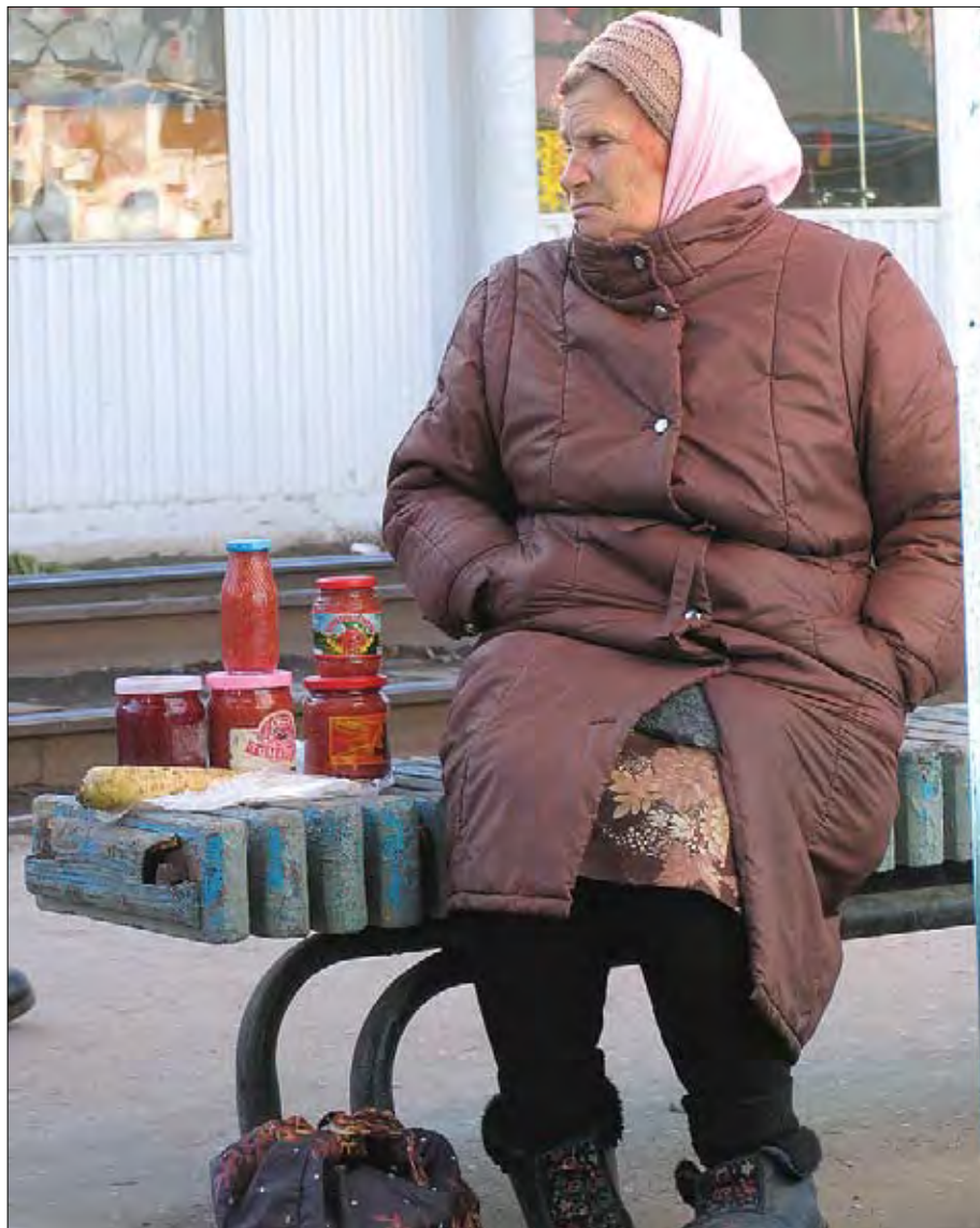
Малая прибавка к пенсии — если, конечно, купят у нее что-то (покупатели сами небогаты) да если не прогонят старушку ретивые чиновники.