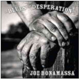
Joe Bonamassa Blues Of Desperation, 2016

Вот скажите, вам много Бонамассы или мало? Станный вопрос. Но если вдуматься, то найти на него ответ не так просто. С одной стороны, кажется, что Бонамасса всегда и везде. К тридцати восьми годам неутомимый блюз-рокер выпустил более двадцати, а на самом деле, думаю, больше альбомов. Из них двенадцать, что называется, номерных работ. Кроме того, он с Гленном Хьюзом, Джейсоном Бонэмом создал Black Country Communion и еще два альбома выпустил под этим лейблом. Он выпускал диски с Бэт Хартом (два) и Махалией Бёрнс. Он перепел работы старых мастеров Мадди Уотерса и Хаулина Вулфа. Он выступает с акустическими концертами и в сопровождении симфонических оркестров. А уж работ соратников по цеху, где он сыграл пару соло, вообще не счесть. Что это — меркантильность? Не хочется думать так, тем более место самого богатого музыканта уже отдано навсегда российскому виолончелисту Сергею Ролдугину. Или же неуёмная, бьющая через край энергия, которую музыкант стремится проявить, как только предоставляется возможность. Словом, вопрос, много Джо в современной музыке или мало, решать вам самим. Но одно не отнять: он великий музыкант, король. И если в классическом блюзе трон сейчас отдан Бадди Гаю, но в современном блюзе, блюз-роке Бонамасса, без всяких сомнений, король. И последний альбом тому подтверждение.