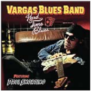
Vargas Blues Band Hard Time Blues, 2016

Итак, мы временно выходим из цеха, где куют тяжелый металл. Отдохнем от мощных рифов, грохота барабанов и резкого, как визг бензопилы, вокала. Вернемся на землю обетованную, поговорим о блюзе, пока самый авторитетный из всех живущих музыкантов Певец Плата Юрий Лоза не выдал пару уничтожающих этот жанр реплик.