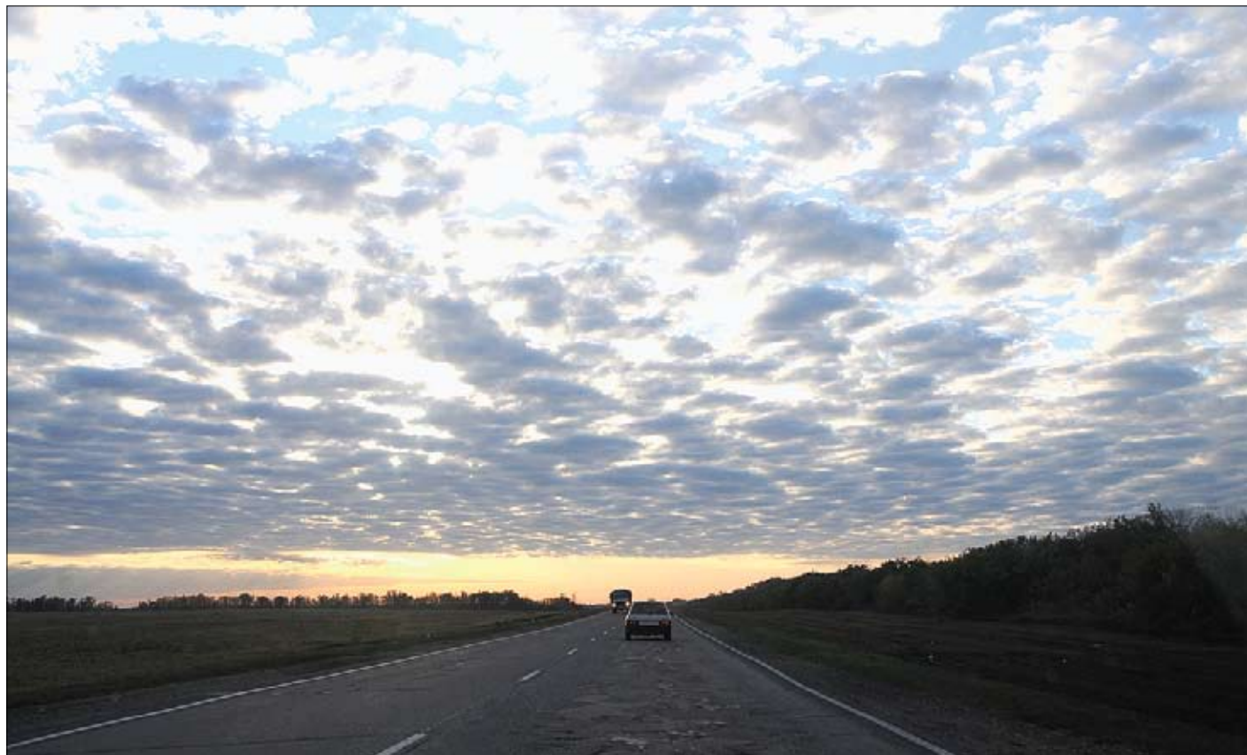
Рассветы, особенно летние, стали приходить на землю саратовскую практически среди ночи.

Саратовцы продолжают спорить, по какому времени стоит жить