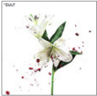
The Cult Hidden City, 2016

Очередной гость нашей рубрики — британская группа The Cult, образованная в уже далеком 1981 году в городе Брэдфорд. Итого — четверть века, а то и более, на сцене. Но Hidden City всего десятый альбом коллектива, получается в среднем больше двух лет на альбом, а то и более, предыдущий Electric Pease вышел в 2013 году. Чем же занимаются музыканты, что столь непродуктивны?