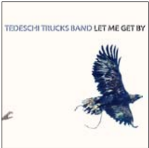
Tedeschi Trucks Band Let Me Get By, 2016

кого особенного жанра нет, чистая эклектика. Здесь может встретиться и эстрадная пьеса, и блюз, и ритм-н-блюз. Но вопреки нашему мнению дебютный альбом группы 2011 года Revelator получил «Грэмми» как лучший блюзовый альбом. Никому не понять, что думало жюри премии, вынося это решение. В Revelator блюза нет и близко, вот во втором альбоме Made Up Mind 2013 этой музыки много. И хорошей.