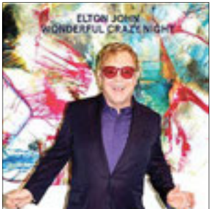
Elton John Wonderful Crazy Night, 2016

Можно ли возвращаться туда, откуда никогда не уезжал? Станный вопрос. Но вот вышел новый альбом сэра Элтона Джона, и критики уверенно пишут, что певец вернулся к своим корням, правда, не самым главным, а еще к каким-то боковым. Короче, в этой ботанике легко можно запутаться. Но суть в том, что сэр Элтон никогда от своих корней и не отрывался, если не считать пары