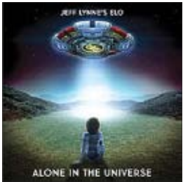
Jeff's Lynne ELO Alone In The Universe, 2015

Итак, секрет разгадан. Какой секрет? А вот такой: читатели нашей рубрики вполне могут упрекнуть автора, что он заиклен на старой музыке, воспеваеет героев шестидесятых-семидесятых годов, которые добрели до наших времен со своими песнями и гитарами.