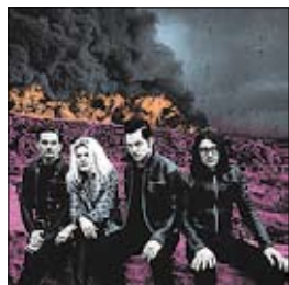
Dead Weather Dodge And Burn, 2015

Поговорим немного о современном роке, а то у нас всё великие старики, проводившие на музыкальной сцене по полвека. Персонально поговорим о Джеке Уайте. В нашей стране он был очень популярен во времена своего дуэта White Stripes, а потом словно исчез с радаров. На самом деле это не так, Джек удивительно многолик, проектов с его участием достаточно. Во-первых, это сольные пластинки самого Джека, последняя работа Lazaretto вышла в 2014 году. Есть еще «проект старых друзей» — группа Raconteurs. Но свой второй и последний, судя по всему, альбом Consolers Of The Lonely они выпустили 25 марта 2008 года.