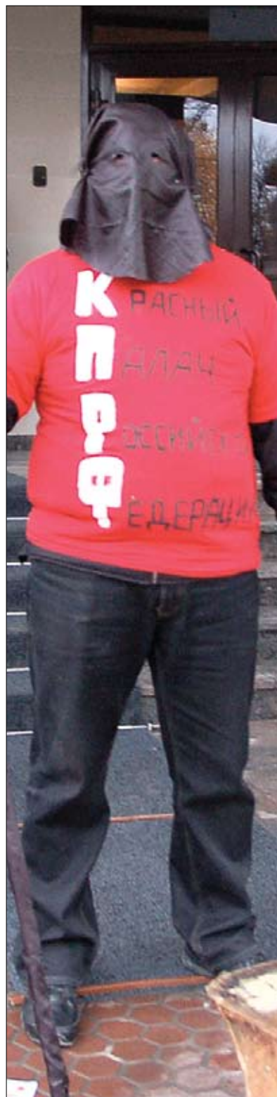
Пока в верхах говорят о единстве молодежи, саратовская МГЕР «воюет» с коммунистами

Так как «Молодая гвардия» — федеральная организация, а мы всего лишь региональное представительство, такие решения по уставу мы принимать неправомерны. Вы можете обратиться в центральный штаб в Москве — я думаю, они вам дадут официальный комментарий от «Молодой гвардии».