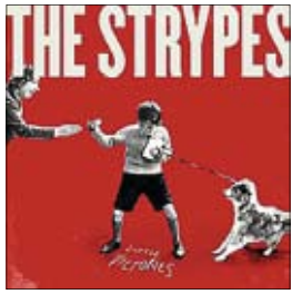
The Strypes Little Victories, 2015

О сколько раз музыкальный мир восклицал: «Вот они, новые мессии! Вот оно, будущее рок-н-ролла! Новые Beatles, новые Rolling Stones, новые Led Zeppelin (это особенно часто. — Прим. ред.)». Не буду сейчас перечислять все группы, удостоенные столь громкими ожиданиями. Наверное, чтобы никого не обижать. Большинство из будущих спассителей рок-н-ролла и сейчас играют свою музыку, вызывают умеренный интерес, но новыми мегазвездами их никто не называет и, боюсь, уже не назовет.