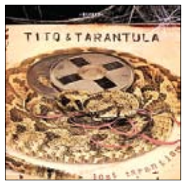
Tito & tarantula Lost Tarantism, 2015