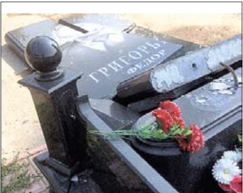
Могила Федора Григорьева.