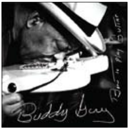
Buddy Guy Born To Play Guitar, 2015

Король умер, да здравствует король. Насколько применима в нашем случае эта формула? Отчасти, сэр, только отчасти. Ибо король Б. Б. Кинг ушел от нас физически, но не духовно, и его творчество продолжает оставаться эталоном блюза. Современного и несколько припопсованного, добавим от себя. Но трон его освободился, это факт. Также является фактом, что верна русская поговорка «Свято место пусто не бывает», причем в слове «свято» нет никакой иронии. Короче, вывод из этого вступления таков: из ныне живущих блюзменов королем является Бадди Гай. Или пусть будет так — Бадди является патриархом жанра. Он и по возрасту подходит — семьдесят девять лет, — и по творческой активности, которой могут позавидовать многие молодые музыканты.