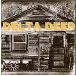
Delta Deep Delta Deep, 2015

Как вы думаете, какой музыки можно ждать от группы Delta Deep с дебютной пластинкой Delta Deep? Для подсказки перевод — «Глубокая дельта», а если точнее — «Центр дельты». Тут и ребенок ответит: только блюза можно ждать от такого коллектива. Но вот в списке музыкантов видишь имя Фила Коллена. Да, это он, гитарист легендарной английской группы Def Leppard, участник записи мегауспешных альбомов Hysteria и Piromania. Но, позвольте, Def Leppard играл легкий металл, глэм-металл, хард-рок — ряд определений можно продолжить. Нам не дано знать, почему хардовый гитарист вдруг стал гитаристом блюзовым. Но он им стал, и это факт. Похоже, если поскрести любого рок-музыканта, обнаружишь фаната блюза. Сам Фил объясняет так: «Я рос на рок-музыке, но затем я обнаружил, что она полностью основывается на блюзе. Джимми Пейдж, Кит Ричардс, Ричи Блэкмор, Джимми Хендрикс — все эти ребята черпали идеи из блюза».