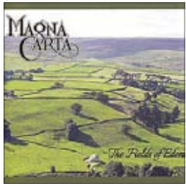
Magna Carta Fields Of Eden, 2015

В прошлый раз, говоря о пластинке Билла Уаймена, мы называли источники английской рок-музыки — блюз, рок-н-ролл и английскую эстраду 50-х годов. Понятно, что этот список далеко не полон. Давайте добавим еще один элемент — британскую народную музыку. Первые элементы фольклора были замечены в творчестве Beatles — не зря же их называли основоположниками всего и вся. Прекрасная группа Kinks выпустила целый альбом, посвященный сельской тематике: Village Green Preservation Society — «Общество сохранения зеленых деревень». Постепенно фолк-рок стал оформляться как полноценный жанр — со своими законами и правилами. Оставим в стороне такое богатое течение, как американский фолк-рок, поговорим совсем немного об английском фолк-роке. Законодателем жанра можно считать группу Fairport Convention, а правила, которые они заложили, — это девушка у микрофона (лучшей в FC была Сенди Денни, впрочем, другие музыканты тоже пели) и скрипка как один из солирующих инструментов. Таким же почти обязательным правилом для фолк-рок-коллективов стала постоянная сменяемость составов.