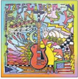
Jeff Liberman Fantasy, 2015

Итак, после недолго путешествия по другим музыкальным жанрам мы возвращаемся в родную блюзовую гавань. Наш сегодняшний герой, полагаю, вряд ли известен российским любителям музыки. Тогда позвольте представить — Джефф Либерман. Американец, но разные источники называют его родным штатом то Висконсин, то Иллинойс.