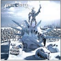
Helloween My God-Given Right

В нашем обзоре пластинка хэви-металлического жанра. А что делать, если лидеры других направлений, словно сговорившись, отдыхают? Хотя стоп, это поклеп, ведь в прошлом номере были